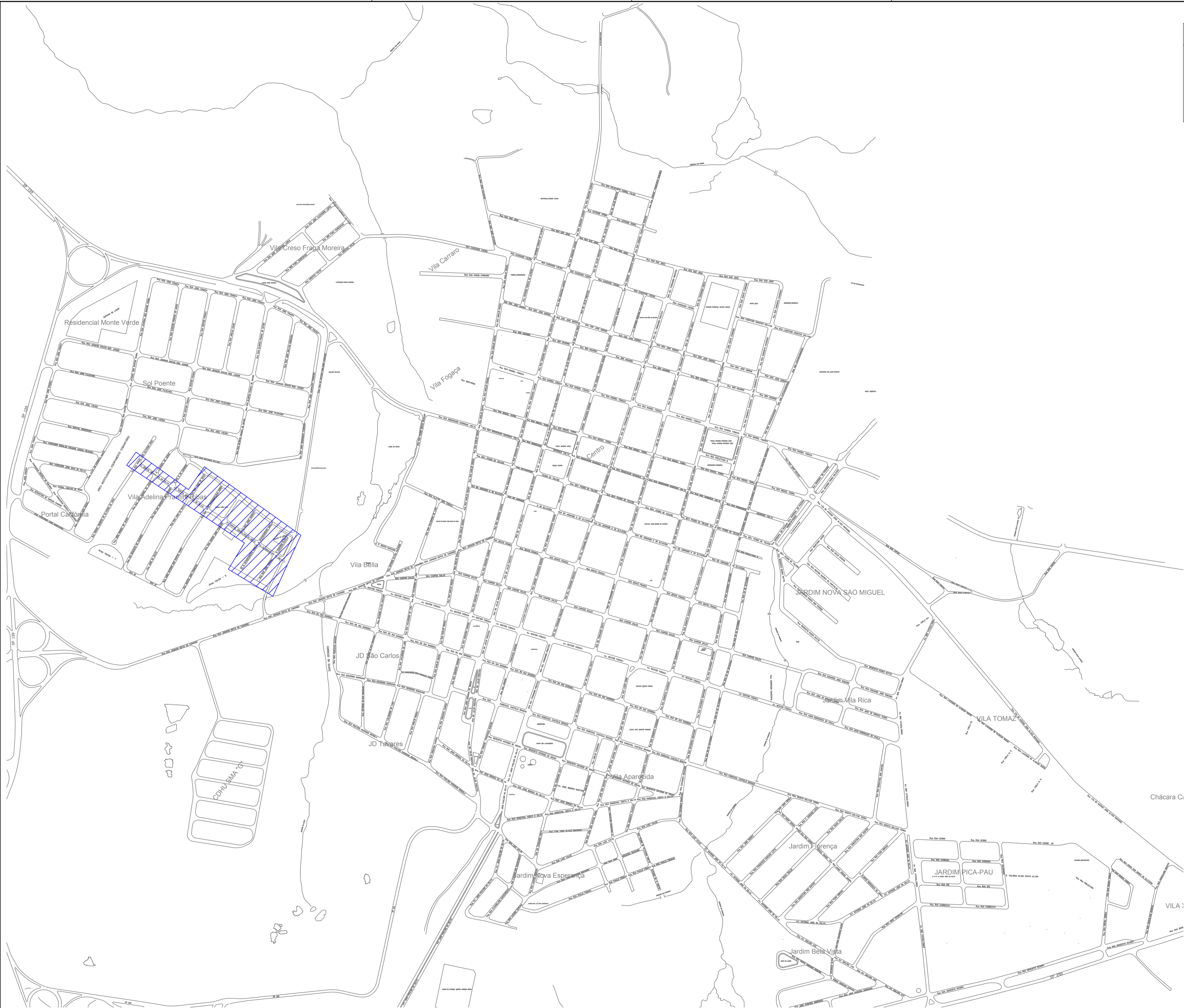
PLANTA BAIXA, ESC 1:5000