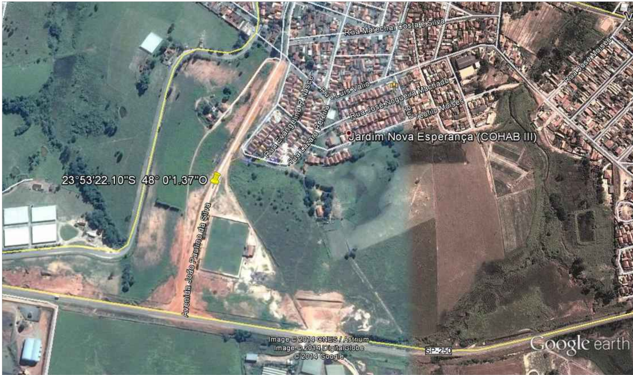
LOCALIZAÇÃO S/ ESC